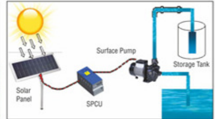
सोलर सरफेस पंपिंग सिस्टिम